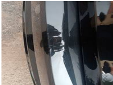
Bouclier arrière (Peinture)